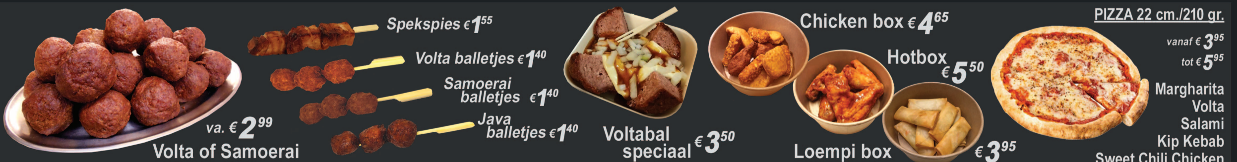
Spekspies € 1 55 Volta balletjes € 1 40 Samoerai balletjes € 1 40 Java balletjes € 1 40 Voltabal speciaal € 3 50 Chicken box € 4 65 Hotbox € 5 50 Loempi box € 3 95 PIZZA 22 cm./210 gr. vanaf € 3 95 tot € 5 95 Margharita Volta Salami Kip Kebab Sweet Chili Chicken