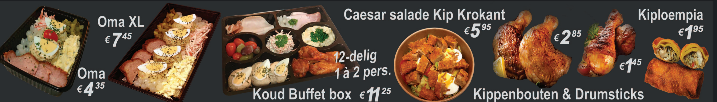
Oma XL € 7 45 Oma € 4 35 Caesar salade Kip Krokant € 5 95 Kiploempia € 1 95 12-delig 1 à 2 pers. Koud Buffet box € 11 25 Kippenbouten & Drumsticks € 2 85 € 1 45