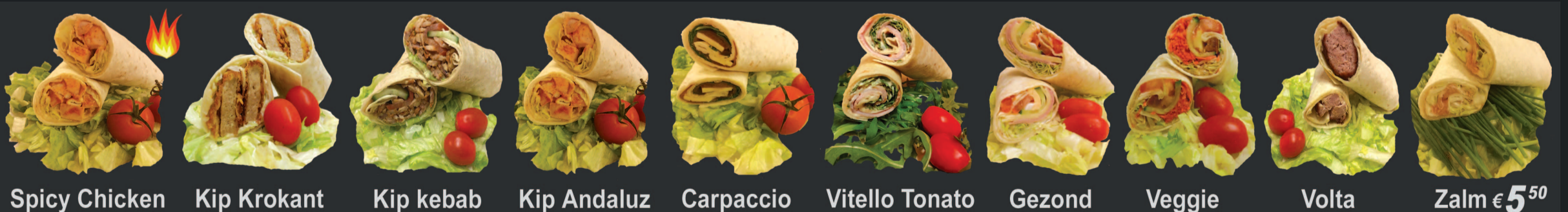
Spicy Chicken Kip Krokant Kip kebab Kip Andaluz Carpaccio Vitello Tonato Gezond Veggie Volta Zalm € 5 50