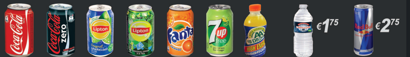
€ 1 75 € 2 75