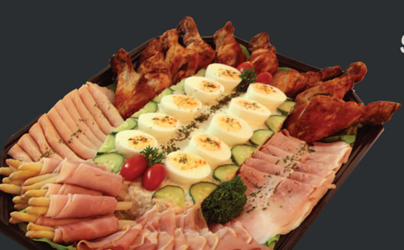
BASIS SCHOTEL van LUXE buffet

stel naar wens een buffet samen met een standaard schotel van één van onze All-In buffetten en kies nu zelf je salades, sauzen & brood