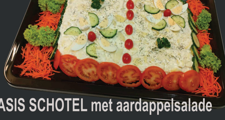
BASIS SCHOTEL met aardappelsalade