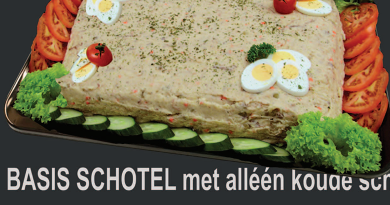
BASIS SCHOTEL met alléén koude schotel

vul de BASIS schotels aan met salades, sauzen & brood of met onze koude of warme aanvullingen