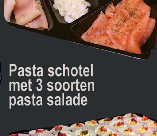
Pasta schotel met 3 soorten pasta salade