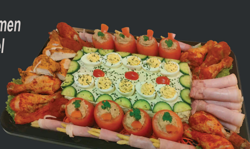
BASIS SCHOTEL van EXCLUSIEVE buffet

stel naar wens een buffet samen met een standaard schotel van één van onze All-In buffetten en kies nu zelf je salades, sauzen & brood